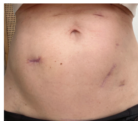
Før SKINlight lysterapi.