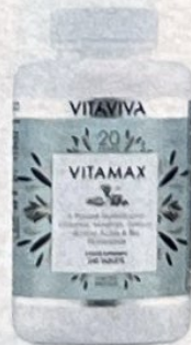
Vitamax, Vitaviva, 240 stk., 475 kr.

"Jeg elsker i det hele taget makeup, men hader det på mit ansigt"