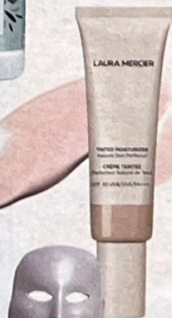
Skinlight Lysterapi Maske, Medicoline, 1.199 kr.