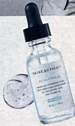
Hydrating B5 Serum, Skin Ceuticals, 560 kr.